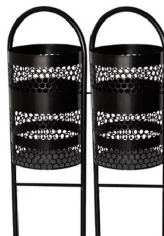
Item 4 – Imagem ilustrativa

4.1 – DO PREÇO ESTIMADO: R$ 186.286,00 (cento e oitenta e seis mil, duzentos e oitenta e seis reais).