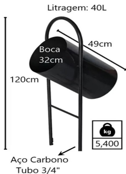
Item 1 – Imagem ilustrativa

(37) 3229-6650 – obras.divinopolis@gmail.com